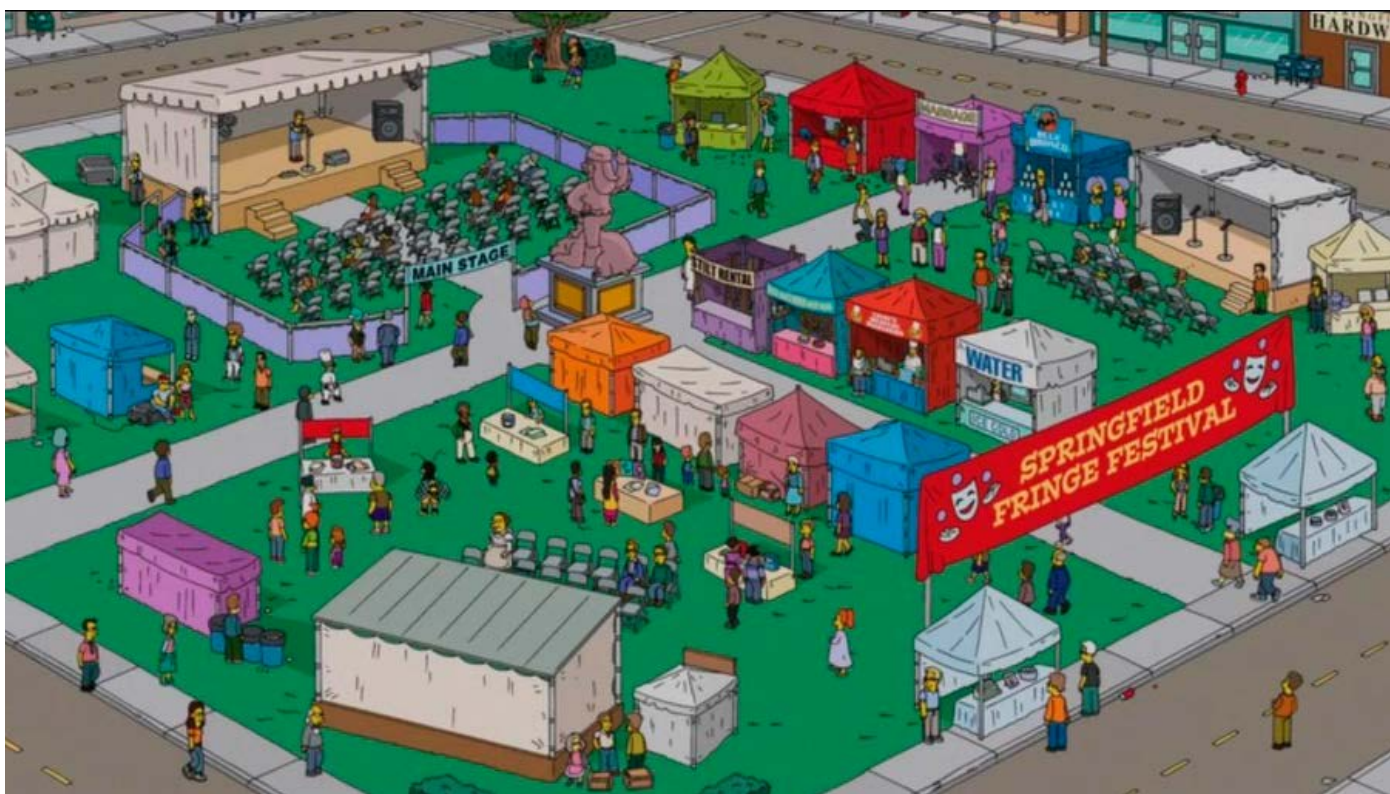
Simpsons Springfield (USA) Fringe Festival - Ter illustratie van het wereldwijde belang van Fringe.

NTF is sinds twee jaar mede-initiatiefnemer (samen met Battersea Arts Centre in Londen en Het TheaterFestival Vlaanderen) van Scene Change : een uitwisselingsprogramma tussen Engeland, België en Nederland met als doel contacten en horizons van (specifiek) makers te verbreden. Uitkomsten zijn: kennisdeling over makerschap in de drie landen en een basis voor verdere samenwerking tussen de deelnemende makers.