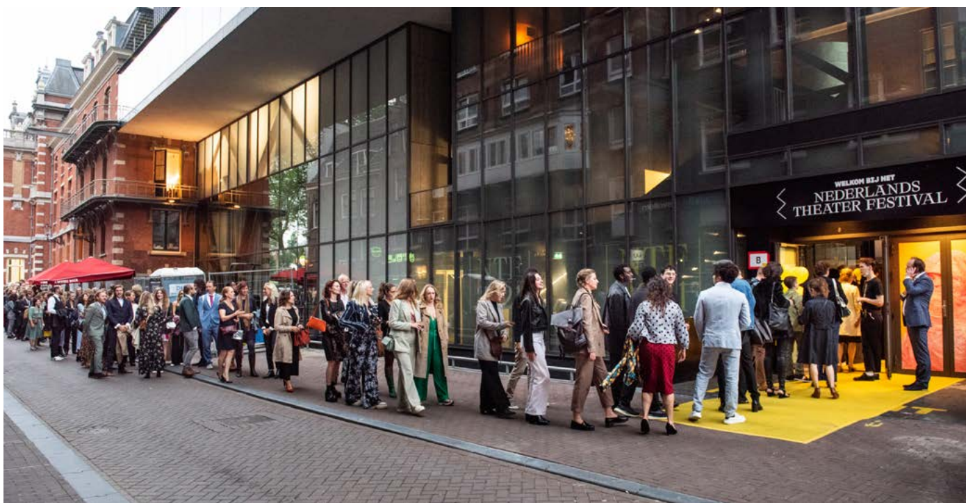
Bezoekers NTF 2021 (Anna van Kooij)

AFF heeft hogere bezoekersaantallen zeker als ambitie (en is ook goed op weg: van 7048 in 2021 tot 15211 in 2023) maar waakt ervoor om groeidoelstellingen in cijfers en percentages uit te drukken. Voor een festival dat plek geeft aan experiment en kwetsbaarheid, is volledig uitverkopen immers niet het hoogste doel. Bovendien gebeurt een deel van de publiekswerving door de beginnende makers zelf, als onderdeel van hun talentontwikkeling bij AFF, waarvan de resultaten jaarlijks wisselen. Wat we gelukkig wél zien is dat het AFF-publiek sinds 3 jaar meer verjongt en vaker terugkomt. Ook is er een grotere groep trouwe bezoekers. Sinds 2022 is ingezet op grootschalige